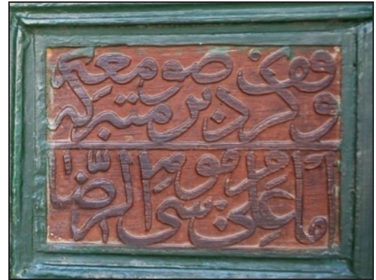
تصویر ۸. کتیبه چوبی ۹۳۷ق صومعه امام علی موسی الرضا، مسجد فرط یزد.