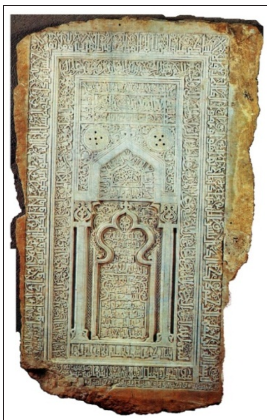
تصویر ۷. سنگ‌نوشته قدمگاه فراراه به تاریخ ۵۱۲ق که در میراث فرهنگی یزد نگهداری می‌شود.