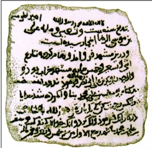
تصویر ۱۵. سنگ‌نوشته مشهدک خراتق به تاریخ ۵۹۵ق و بانی تعمیر بنا.