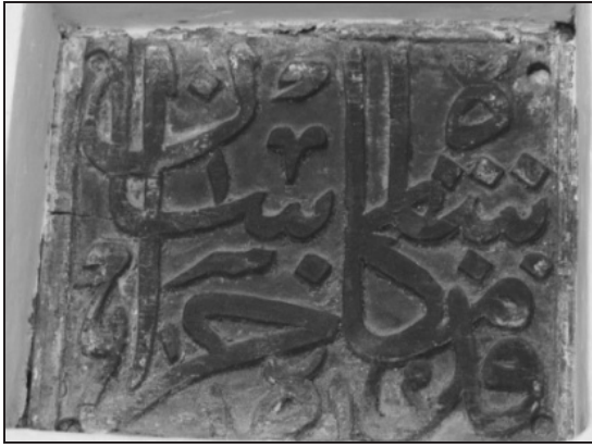
تصویر ۱۰. کتیبه چوبی «قدمگاه شاه خراسان» منصوب بر دیوار صومعه امام رضا، مسجد فرط یزد.