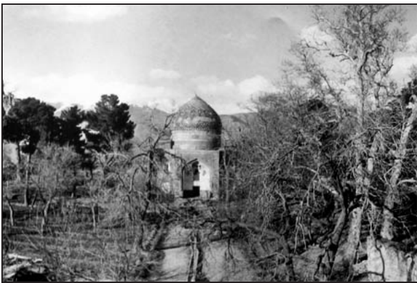
تصویر ۱۷. قدمگاه علی بن موسی الرضا در بیرون نیشابور.