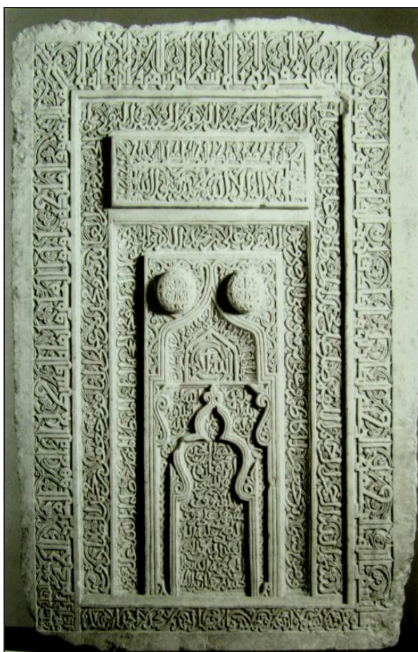
تصویر ۳. سنگ‌نوشته مسجد توران‌پشت به تاریخ ۵۴۹ق که در فریز گالری واشنگتن نگهداری می‌شود.