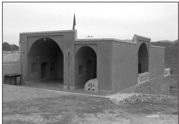
تصویر ۱۴. بنای مشهدک خراتق پس از بازسازی.