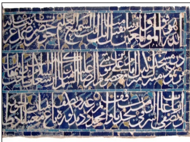
تصویر ۲. بخشی از کتیبه کاشی معرق مسجد بیرون ابرکوه که نام امام معصوم علی بن موسی الرضا در آن ذکر شده است.