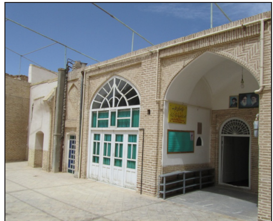
تصویر ۹. جبهه شمالی مسجد فرط یزد.