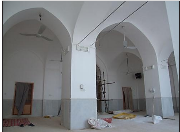
تصویر ۱۳: شبستان مسجد المیر یزد.