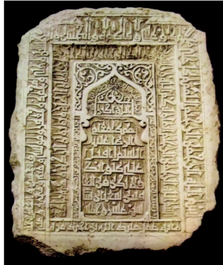
تصویر ۱۲. سنگ مقام حضرت رضا به تاریخ ۵۱۶ق که اکنون در موزه آستان قدس رضوی نگهداری می‌شود.