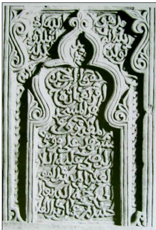
تصویر ۴. بخش پایینی سنگ‌نوشته مسجد توران‌پشت که نام علی موسی الرضا در آن نوشته شده است.