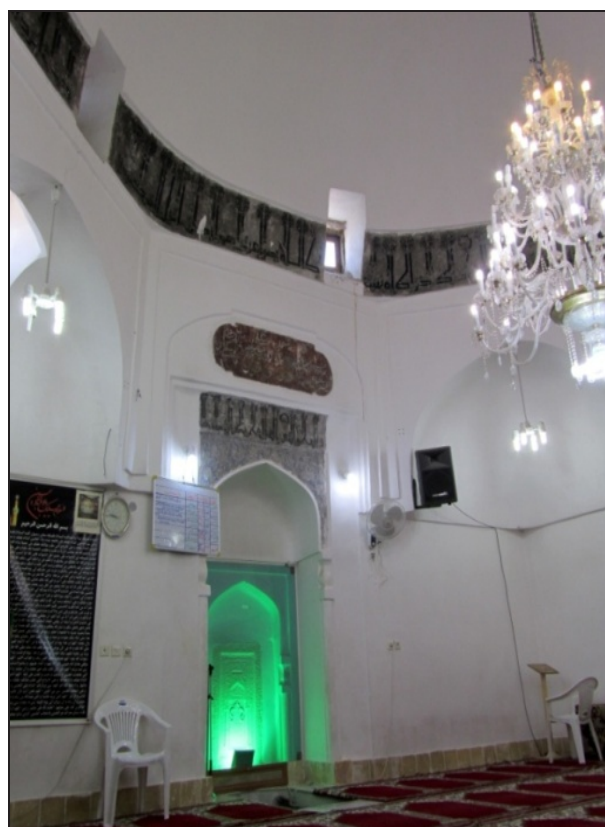
تصویر ۶. داخل گنبدخانه فراراه: کتیبه‌های پای گنبد و بالای محراب.