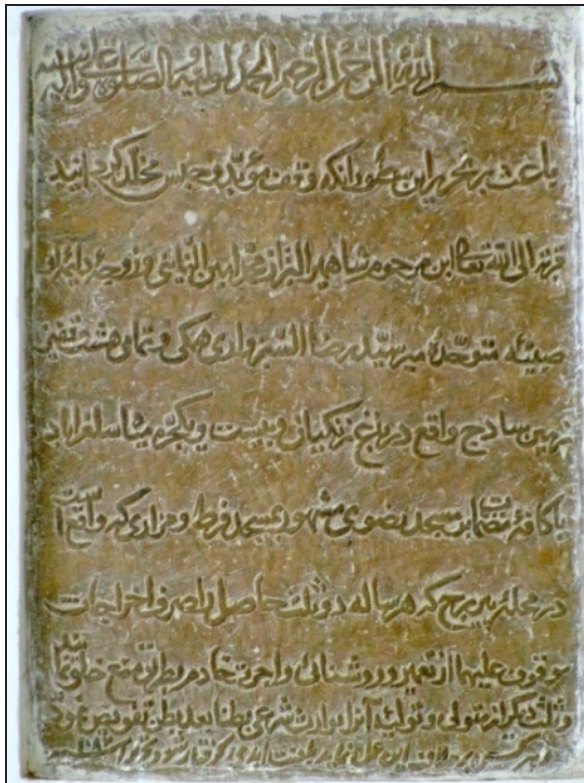
تصویر ۱۱. کتیبه سنگی وقف‌نامه به تاریخ ۱۰۸۶ق منصوب بر دیوار مسجد فرط یزد.