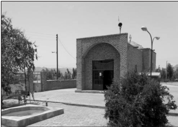
تصویر ۱۶. امامزاده رباط پشت‌بادام.