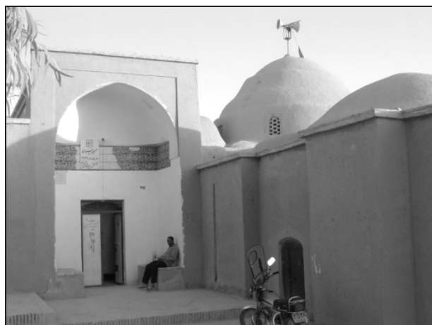
تصویر ۱. مسجد بیرون ابرکوه از چشم‌انداز ورودی.